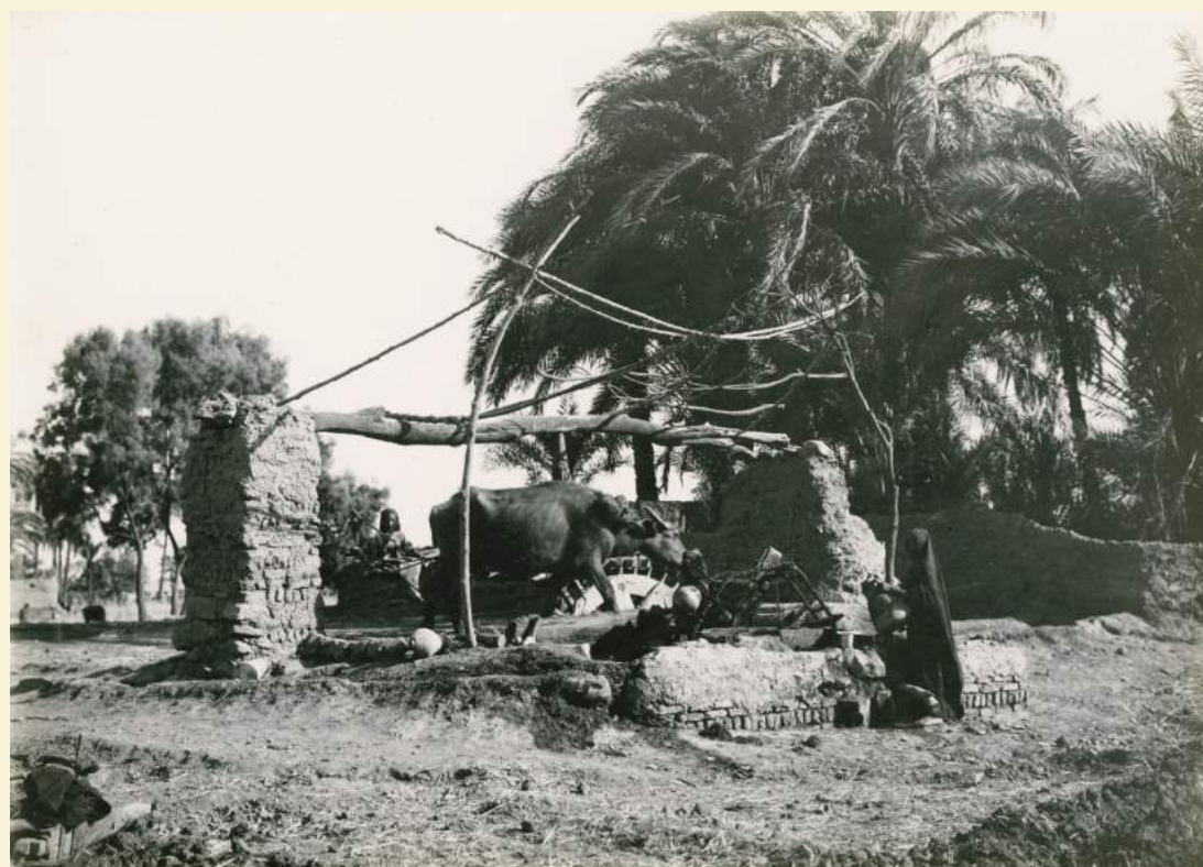
Maszyna nawadniająca nad Nilem w okolicy Luksoru, 1925