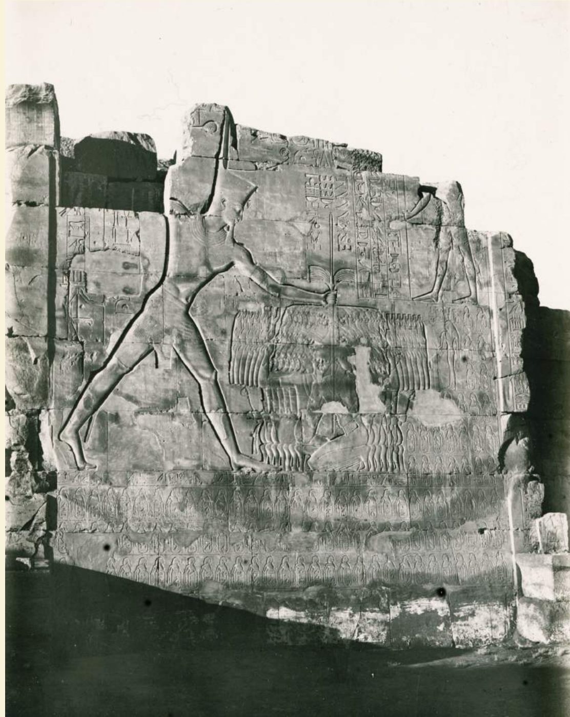
Karnak, Ramzes ścinający głowy niewolnikom, 1925