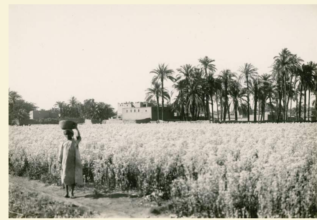
Pole sorga w Egipcie środkowym, 1925