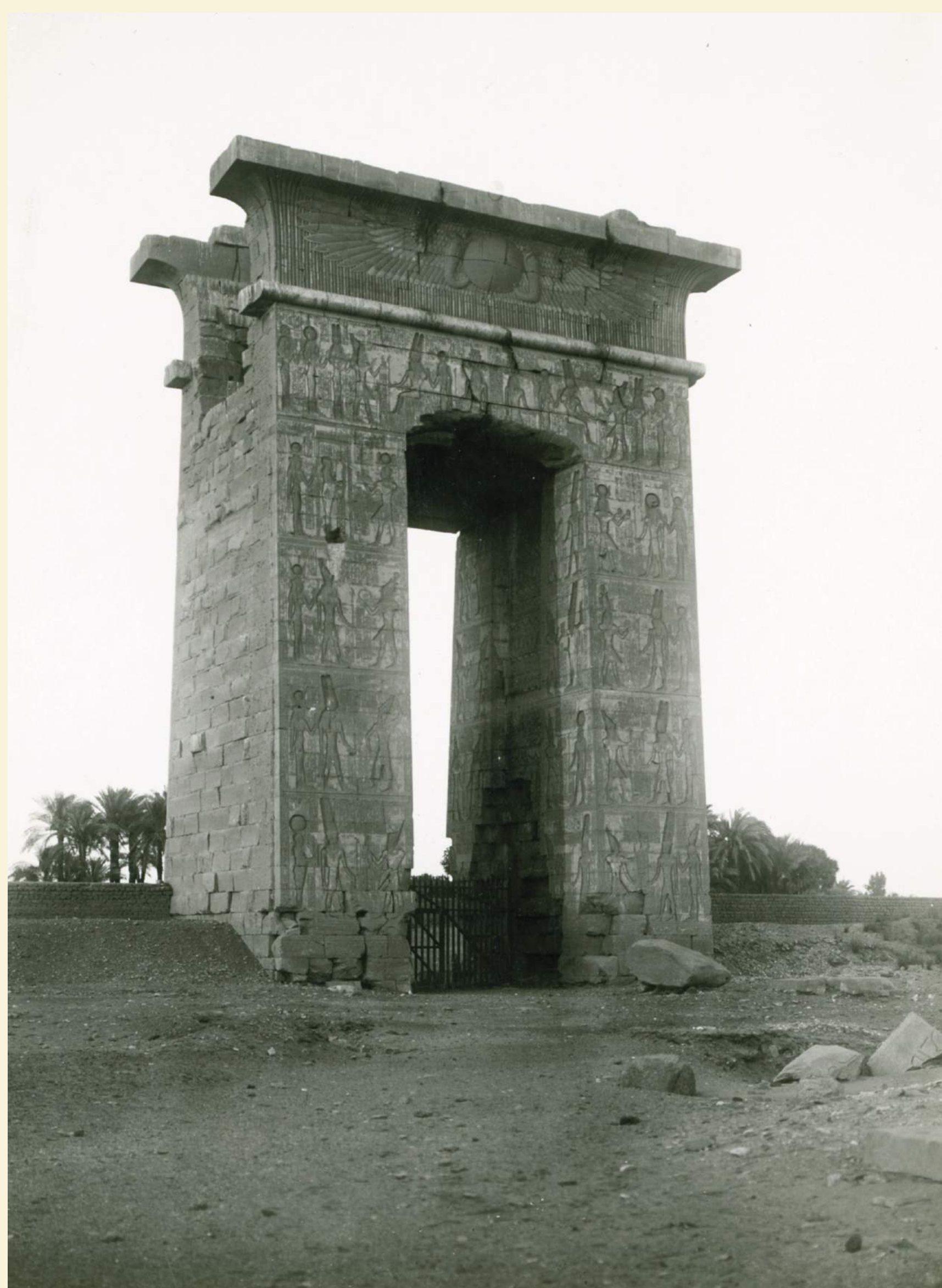
Karnak, pylon północny, 1925