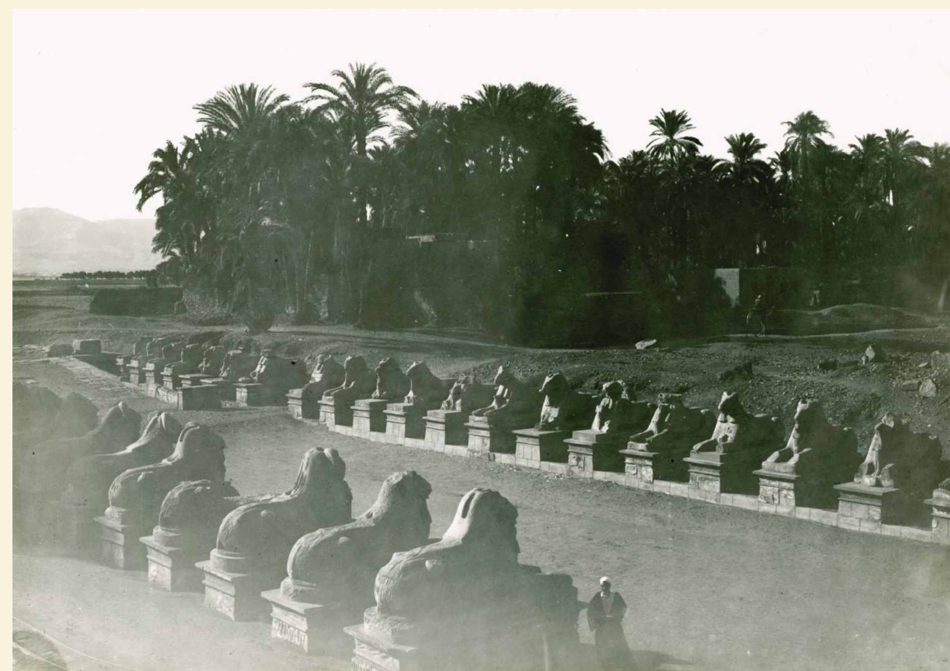
Aleja sfinksów przy wejściu do ruin świątyni w Luksorze, 1925